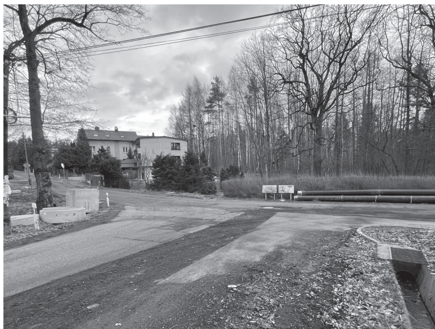
Skrzyżowanie ulic Wiosennej, Zagrodowej i Majowej po przebudowie pełnić będzie rolę mini ronda.