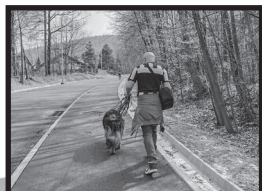
drogi i chodniki