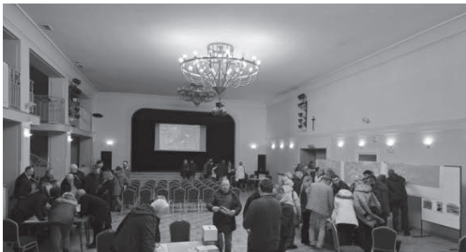
Spotkanie w Kozach – dotyczące budowy Beskidzkiej Drogi Integracyjnej i związanych z nią zakresów pracy – było pierwszym tego typu związanym z planowaną budową drogi ekspresowej przebiegającej przez naszą miejscowość.

W tym celu, również na terenie gminy Kozy, geolodzy przeprowadzą odwierty o średniej głębokości 11 metrów. To niezbędne, aby odpowiednio zaprojektować nasypy czy fundamenty mostów i wiaduktów. Jednocześnie działania te nie wiążą się z większą uciążliwością dla mieszkańców, teren przywracany jest do stanu pierwotnego, choć wykonanie prac wymaga zarazem zgód na prowadzenie badań na poszczególnych działkach, gdzie BDI ma przebiegać. Już na obecnym etapie przygotowawczym wyraźnie nadmieniono, że osoby, których nieruchomości znajdują się na trasie przyszłej drogi ekspresowej, będą mogły liczyć na odszkodowania na podstawie sporządzonych operatów szacunkowych. (RED)