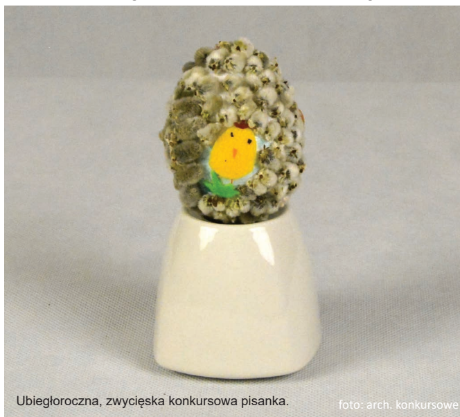
Ubiegłoroczna, zwycięska konkursowa pisanek.

Przed nami 17. edycja Konkursu na Koziańską Pisanek Wielkanocną. Prace w dowolnej technice wraz z wypełnioną kartą zgłoszenia (dla nieletnich wypełniają opiekunowie prawni) złożyć należy w recepcji Pałacu Czeczów w Kozach w dniach od 31 marca do 4 kwietnia br. do godz. 17.30. – Zachęcamy do przygotowania prac zdobionych metodami tradycyjnymi - tzw. pisanek, malowanek, kraszanki, drapanek itp. – mówią organizatorzy. Karty zgłoszenia dostępne są do pobrania na stronie internetowej www.domkultury.kozy.pl w zakładce „Konkursy” lub w pałacowej recepcji. Na stronie Domu Kultury w Kozach dostępny jest również szczegółowy regulamin konkursu. Prace należy podpisać imieniem i nazwiskiem oraz wiekiem autora /ów – możliwe są prace wykonane przez więcej niż jedną osobę. Zgłoszone prace będzie można podziwiać podczas wystawy w Pałacu Czeczów w Kozach w dniach 7-11 kwietnia br. w godz. 9.00-17.00. Rozstrzygnięcie konkursu nastąpi w piątek, 11 kwietnia br. o godz. 17.00 w Pałacu Czeczów w Kozach. Stowarzyszenie na Rzecz Rozwoju i Promocji Gminy Kozy zaprasza i zachęca do wzięcia udziału w Konkursie. Osoby wyróżnione otrzymają nagrody rzeczowe i dyplomy. (DK)