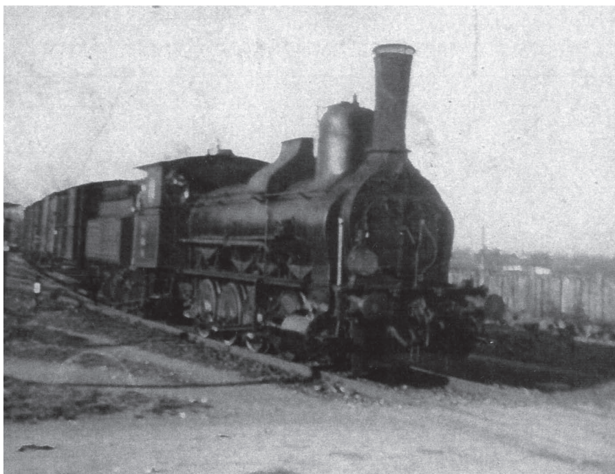
Parowóz przed przejazdem kolejowym przy dzisiejszej ulicy Przecznej, lata 20. XX w.