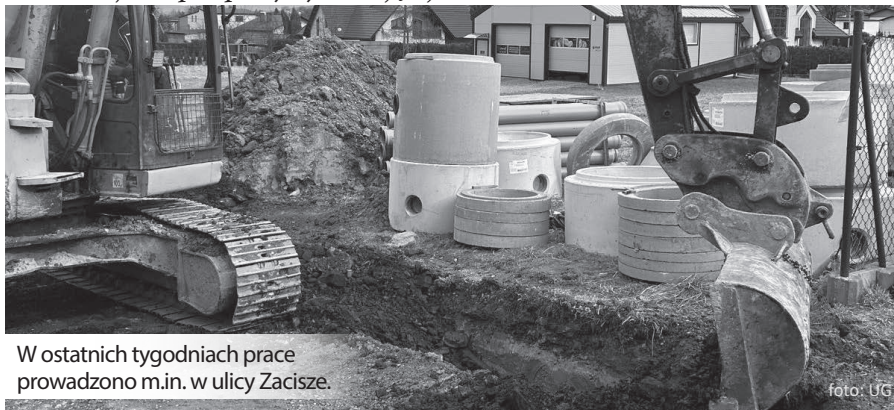
W ostatnich tygodniach prace prowadzono m.in. w ulicy Zacisze.