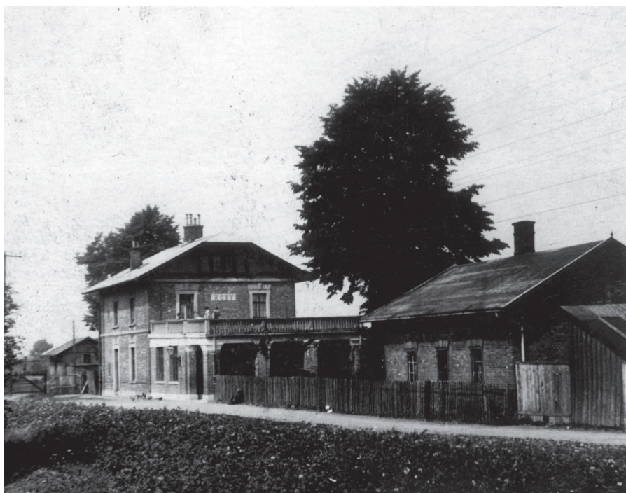
Budynek stacji kolejowej w Kozach, fot. z lat 30 XX w.