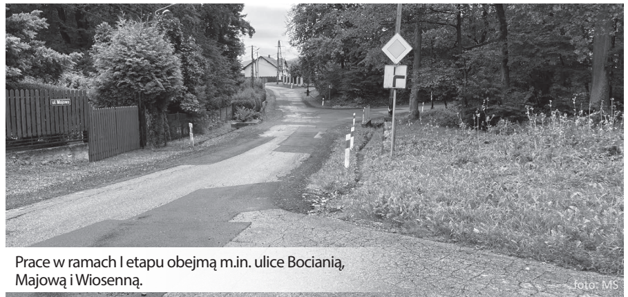
Prace w ramach I etapu obejmą m.in. ulice Bociania, Majową i Wiosenną.

Informacje dotyczące inwestycji: telefonicznie – 33 829-86-52 lub osobiście w Urzędzie Gminy Kozy, pokój nr 23 (II piętro).