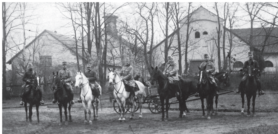
Grupa żołnierzy armii austro-węgierskiej w listopadzie 1914 r. przed pałacem Czeczów. W tle widoczne zabudowania gospodarcze wraz z wieżą zegarową.

W ostatnim czasie budynek „domu pod zegarem” przechodzi gruntowny remont elewacji, dzięki czemu kolejny obiekt zespołu dworskiego odzyska dawny blask. Czekamy na kolejne. (Bartłomiej Jurzak)