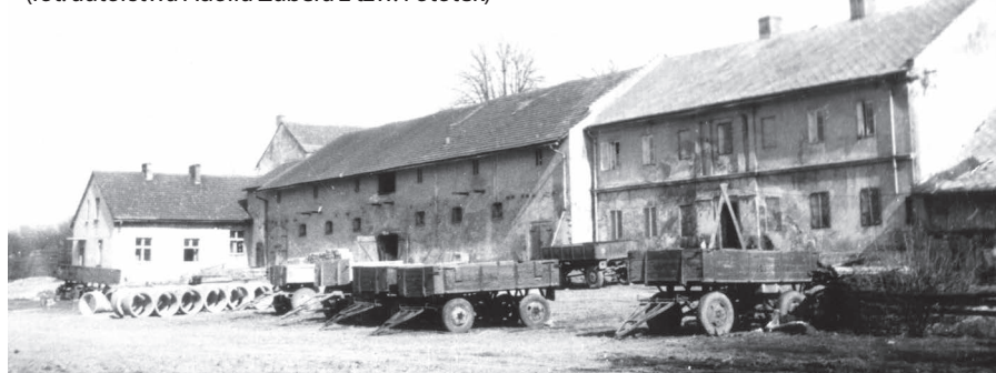
Zabudowania gospodarcze dworu, użytkowane w latach 60. XX w. przez Kółko Rolnicze