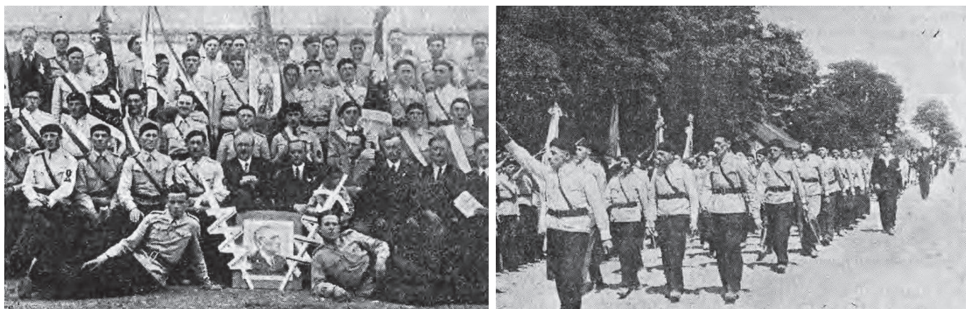
Fotografie z dziennika „Orędownik” z 1937 r. – poświęcenie proporca Stronnictwa Narodowego koła w Kozach.

Do największej tragedii doszło jednak dziesięć lat później, w czasie spotkania oplatkowego, które w Domu Katolic-