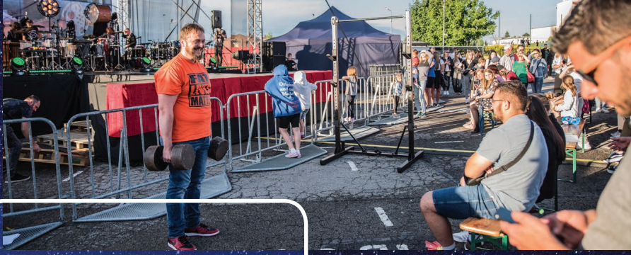
Emocji dostarczyły zawody strongman przygotowane przez Perfect Body Studio EMS/ Treningi Personalne. Przeprowadzono je w dwóch konkurencjach – podnoszenia jedną ręką z ziemi hanthli o wadze 100 kg oraz podciąganiu się na drążku.