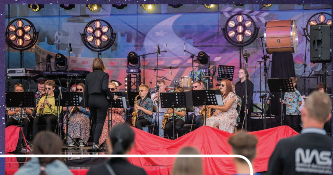
O muzyczną oprawę tradycyjnie zadbały również koziańskie zespoły – Brasownik oraz Młodzieżowa Orkiestra Dęta. Nie zabrakło znanych utworów filmowych, przedstawionych w wyjątkowych aranżacjach przez koziańskich muzyków.